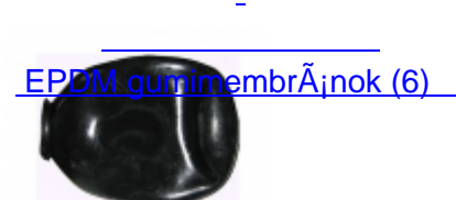
EPDM gumimembránok (6)