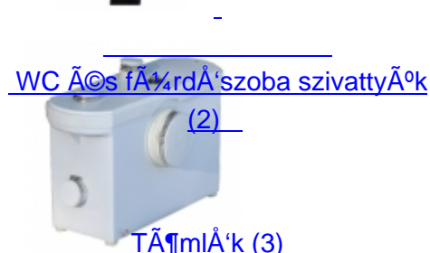
WC és fürdőszoba szivattyúk (2)