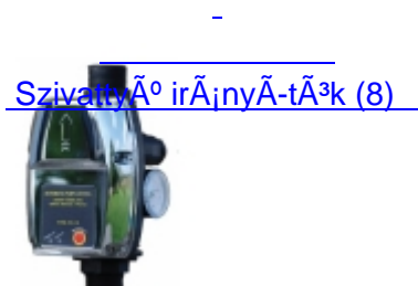
Szivattyú irányítók (8)